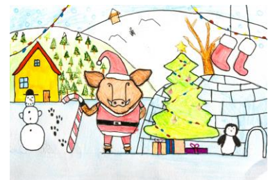
Lynn Hotel, Kl. 7c

Ich wünsche Ihnen nun eine besinnliche Zeit im Kreise Ihrer Familien und alles Gute, Gesundheit und ein friedliches Jahr 2025.